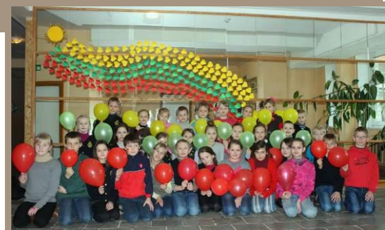
Nuotraukos iš mokyklos archyvo.

Džiaugiuosi, kad mokykla, kurioje padėjau pirmą savo žingsnį mokslo kelyje, tapo gimnazija. Sveikinu visą mokyklos bendruomenę ir linkiu ilgų gyvavimo bei tobulėjimo metų. Tegul šios gimnazijos mokiniai tampa pavyzdžiu visuomenei.